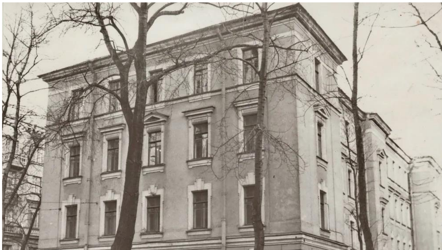
Радиевый институт в Санкт-Петербурге